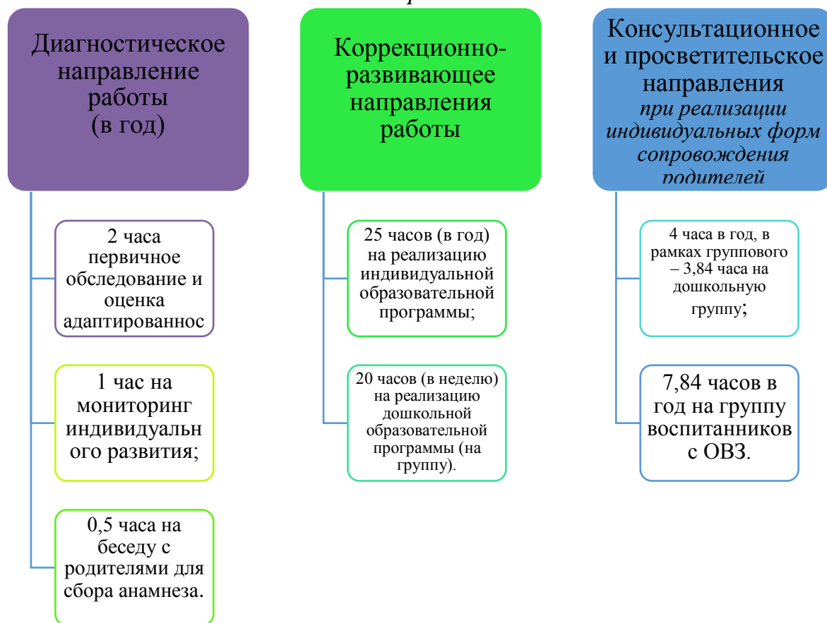
График организации образовательного процесса

В соответствии с письмом Минобрнауки РФ от 24.09.2009 N 06-1216 «О совершенствовании комплексной многопрофильной психолого-педагогической и медико-социально-правовой помощи обучающимся, воспитанникам», на каждого ребенка с ОВЗ